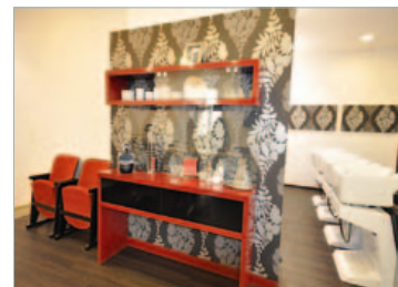
Ein Friseurbesuch wie ein Event

Die beiden haben das schwierige Kunststück voll-