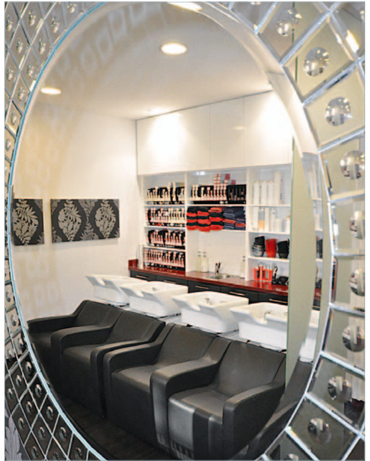
Cool, sexy, stylisch: So soll ein Friseur heute sein